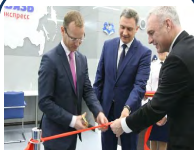
ОТКРЫТИЕ НОВЫХ ЦЕНТРОВ ПРИЕМА ОТПРАВЛЕНИЙ В КРУПНЫХ ГОРОДАХ РФ