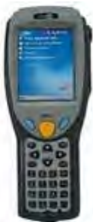
МОБИЛЬНОЕ СКАНИРОВАНИЕ ЭКСПРЕСС- ОТПРАВЛЕНИЙ