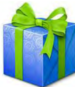
РАСШИРЕНИЕ ПОРТФЕЛЯ УСЛУГ ЭКСПРЕСС- ДОСТАВКИ