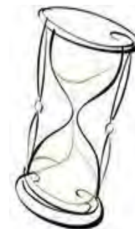
ПОСТОЯННАЯ ОПТИМИЗАЦИЯ СРОКОВ ДОСТАВКИ